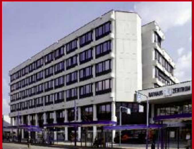
Teilansicht des Gebäudes von der Matthiasstraße nach der Sanierung.